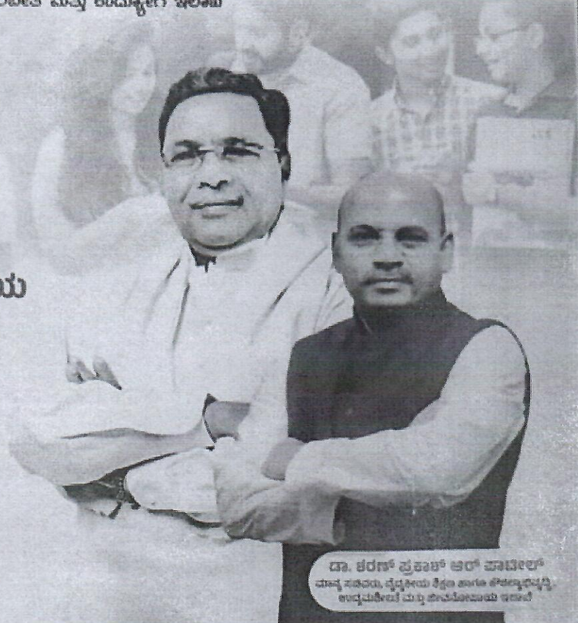
ಡಾ. ಕರಣ್ ಪ್ರಕಾಶ್ ಆರ್ ಪಾಟೀಲ್ ಪನ್ನಾ ಸಚಿವರು, ವೃದ್ಧಿ ಮತ್ತು ಕೈಗಾರಿಕಾ ಉದ್ಯಮಶೀಲತೆ ಮತ್ತು ಉದ್ಯೋಗ ಇಲಾಖೆ

ಪ್ರತೀ 3ಿಂಗಳು ನಿರುದ್ಯೋಗ ಭತ್ಯೆ ₹3000 | ₹1500 ಪದವಿ ಹಾಗೂ ಸ್ನಾತಕೋತ್ತರ ಪದವಿಗಳಿಗಾಗಿ ಡಿಪ್ಲೋಮಾ ಕೈಗಾರಿಕೆಯಿಗಾಗಿ