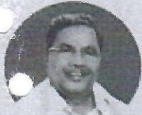
ಶ್ರೀ ಸಿದ್ದರಾಮಯ್ಯ ಪನ್ನಾ ಮುಖ್ಯಮಂತ್ರಿಗಳು ಕರ್ನಾಟಕ ಸರ್ಕಾರ